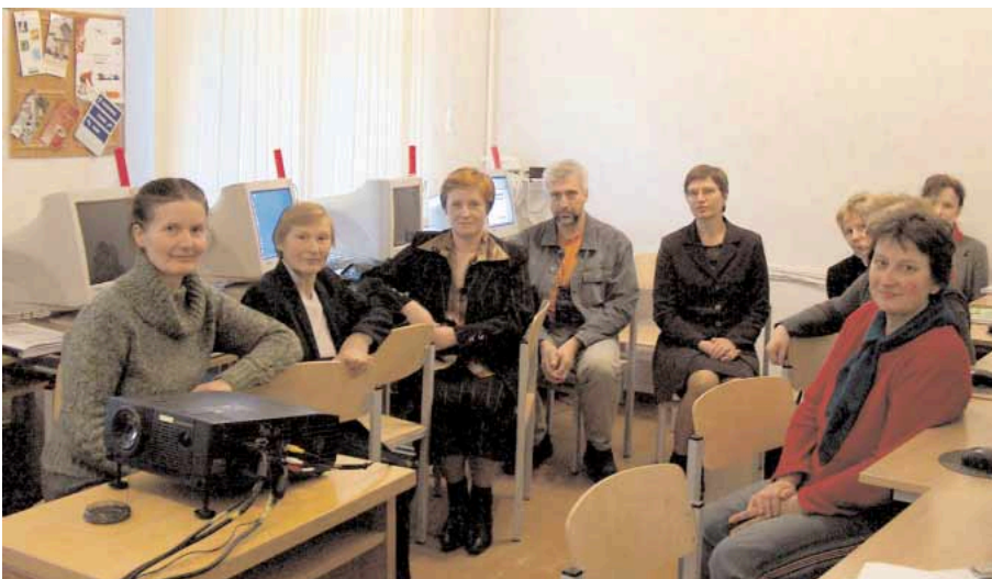
Noslēgusies pirmā pasniedzēju konsultantu grupas apmācība Preiļu rajonā.

maksas izmantot datoru un internetu sabiedriskos interneta piekļuves punktos. Sertifikāta saņēmējiem tiks piešķirta personīgā bezmaksas elektroniskā pasta adrese. Lauku rajonu iedzīvotāji saņems arī atstarotājus ar projekta simboliku, lai tumšajos ziemas vakaros varētu mērot drošu ceļu uz interneta piekļuves punktiem. Viņi iemācīsies ietaupīt laiku un naudu, nomaksājot rēķinus Internetbankā. Protams, būtu nereāli solīt, ka katrs bezdarbnieks tieši pēc šī datorapmācības kursa apguves tūlīt arī saņems darba piedāvājumu. Tas ir tikai pirmais solis ceļā uz pilnvērtīga informācijas sabiedrības pilsoņa dzīvi. Šodien tieši prasme rīkoties ar informāciju ir ikviena cilvēka kapitāls.